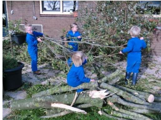
Samenwerken en samen spelen, we leren van elkaar