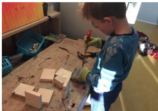
We doen zo veel mogelijk zelf!