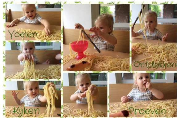
Overall is iets te leren